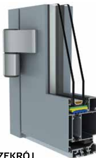
PRZEKRÓJ SYSTEMU 60 DRZWI

Produkty w systemie 60 mogą być montowane zarówno w zabudowie indywidualnej, jak i uzupełniać konstrukcje słupowo-ryglowe.