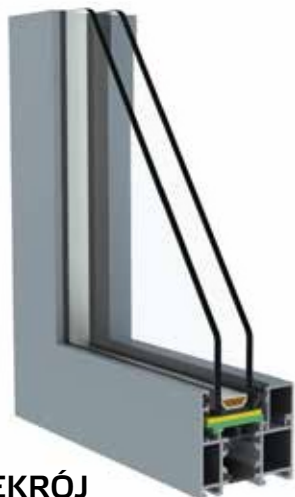
PRZEKRÓJ SYSTEMU 60 WITRYNA

Ważną zaletą systemów zewnętrznych KRISPOL jest możliwość dostosowania sposobu wykończenia profili zarówno do elewacji budynku, jak i stylistyki poszczególnych wnętrz. Opcja bikolor umożliwia zastosowanie odmiennej kolorystyki z zewnętrznej i wewnętrznej strony profili aluminiowych.