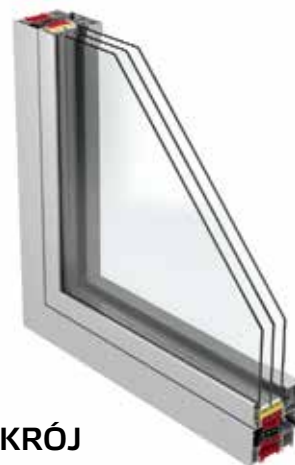
PRZEKRÓJ SYSTEMU 86 WITRYNA

86 to aluminiowy system okiennie-drzwiowy o bardzo dobrych parametrach izolacyjnych oraz wytrzymałościowych, umożliwiającą wykonywanie stabilnej konstrukcji o dużych gabarytach i ciężarze. Doskonała termoizolacja osiągnięta jest dzięki dwukomponentowej uszczelce centralnej oraz możliwości wypełnienia komór profili aerożelem. Szeroki zakres szklenia pozwala na stosowanie wszystkich typów szyb dwukomorowych, akustycznych lub antywłamaniowych. Konstrukcja profili umożliwia montaż różnych rodzajów okuć obwiedniowych, w tym także zawiasów ukrytych, oraz uzyskanie antywłamaniowej klasy RC3.