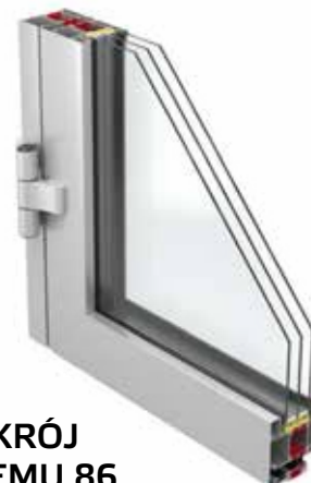
PRZEKRÓJ SYSTEMU 86 DRZWI

86 to aluminiowy system okiennie-drzwiowy o bardzo dobrych parametrach izolacyjnych oraz wytrzymałościowych, umożliwiającą wykonywanie stabilnej konstrukcji o dużych gabarytach i ciężarze. Doskonała termoizolacja osiągnięta jest dzięki dwukomponentowej uszczelce centralnej oraz możliwości wypełnienia komór profili aerożelem. Szeroki zakres szklenia pozwala na stosowanie wszystkich typów szyb dwukomorowych, akustycznych lub antywłamaniowych. Konstrukcja profili umożliwia montaż różnych rodzajów okuć obwiedniowych, w tym także zawiasów ukrytych, oraz uzyskanie antywłamaniowej klasy RC3.